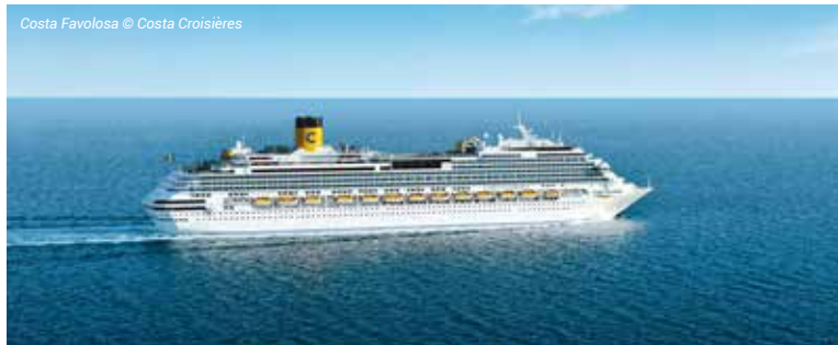
Costa Favolosa

À bord : 9 piscines et jacuzzis, 6 restaurants et snack-bars, 12 bars & Lounge, théâtre.