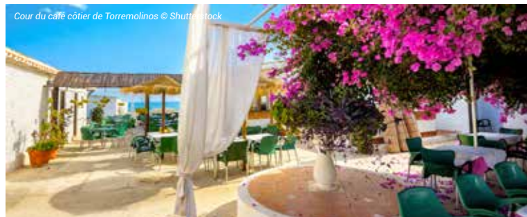
Cour du café côtier de Torremolinos

À votre disposition : piscines. Arrêt de bus devant l'hôtel pour se rendre au centre de Torremolinos.