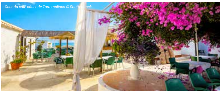
Cour du café côtier de Torremolinos

À votre disposition : piscines. Arrêt de bus devant l'hôtel pour se rendre au centre de Torremolinos.