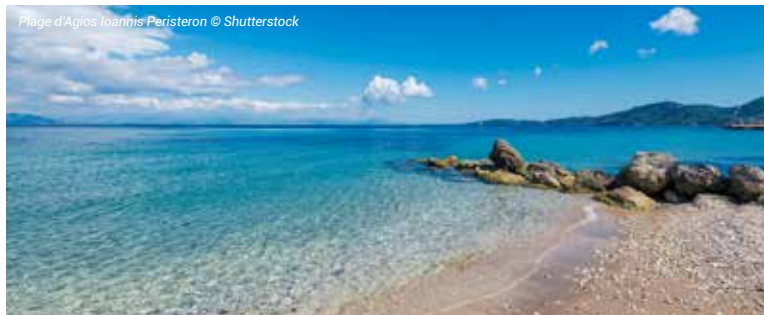
Plage d'Agios Ioannis Peristeron

À votre disposition : deux piscines extérieures d'eau douce, parc aquatique avec trois toboggans pour adultes et enfants, solarium aménagé avec chaises longues et parasols, transats et parasols sur la plage de Messonghi, animations sportives.