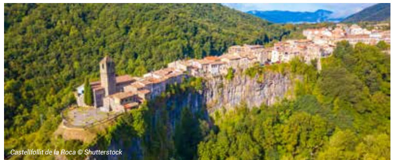
Castellfollit de la Roca

À votre disposition : la plus grande piscine extérieure de Santa Susanna, une piscine pour les enfants et un jacuzzi.