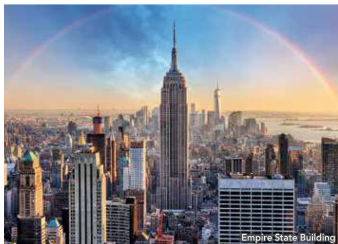
Empire State Building

Vous démarrerez cette journée de visite par l' incontournable Rockfeller Center puis une visite du célèbre Top of the Rock . Visite libre du MoMa . Dédié à l'art contemporain, vous apprécierez d'y découvrir les œuvres des grands noms de la peinture du 20 e siècle. Après le déjeuner, vous prendrez la direction de l'aéroport pour vous envoler à destination de Paris.