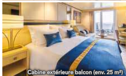
Cabine extérieure balcon (env. 25 m²)