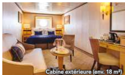
Cabine extérieure (env. 18 m²)