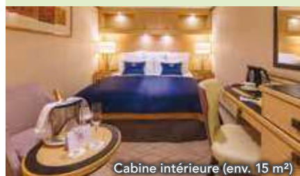
Cabine intérieure (env. 15 m²)