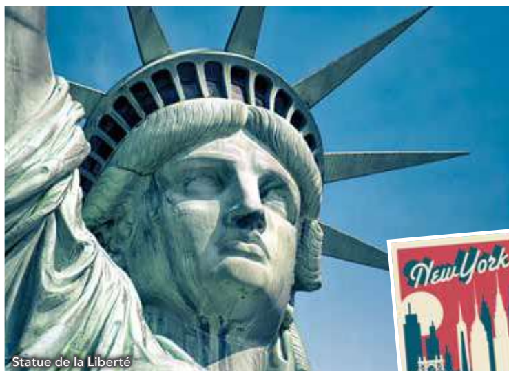
Statue de la Liberté