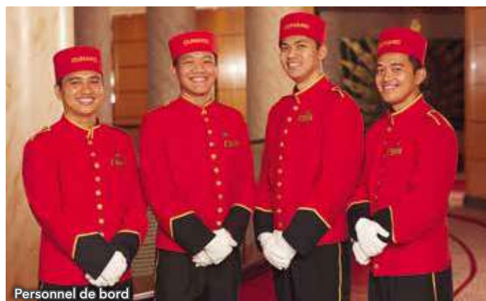
Personnel de bord