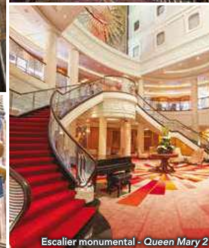
Escalier monumental - Queen Mary 2