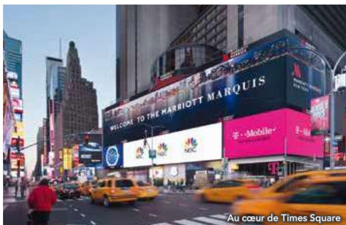
Au cœur de Times Square

L'hôtel Marriott Marquis est idéalement situé au cœur du quartier de Times Square. Cet hôtel 4 étoiles (normes locales) vous séduira par ses chambres spacieuses équipées d'une salle de bain en marbre, d'une télévision à écran plat, d'un radio-réveil iPod, de téléphones, d'un plateau/bouilloire et d'un coffre-fort. Salles de sport, restaurants et bien d'autres équipements complètent agréablement le confort de cet hôtel.