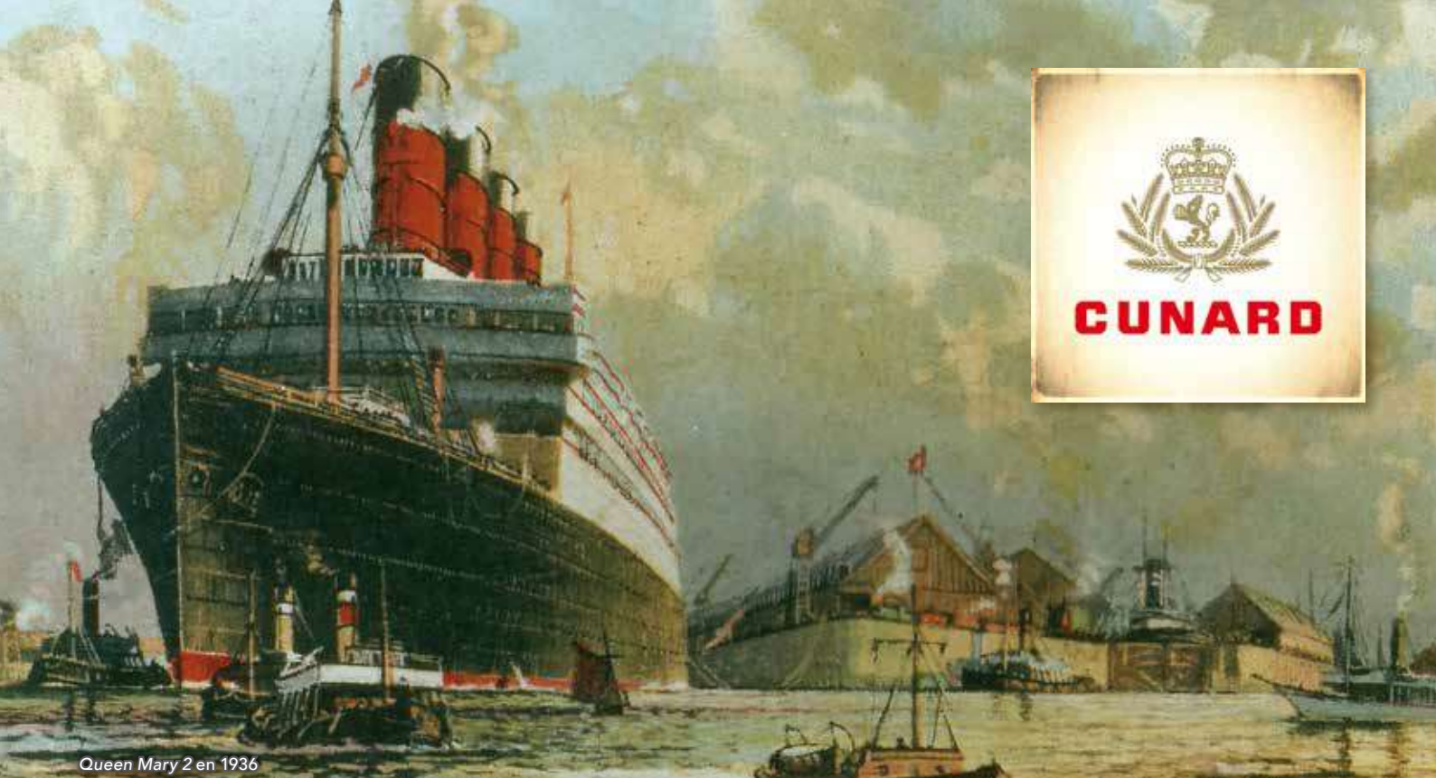
Queen Mary 2 en 1936