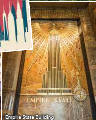
Empire State Building