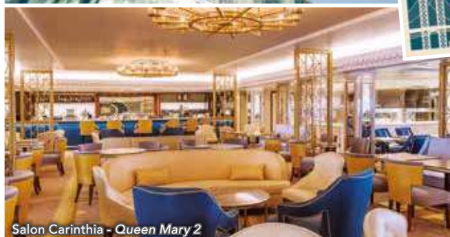
Salon Carinthia - Queen Mary 2