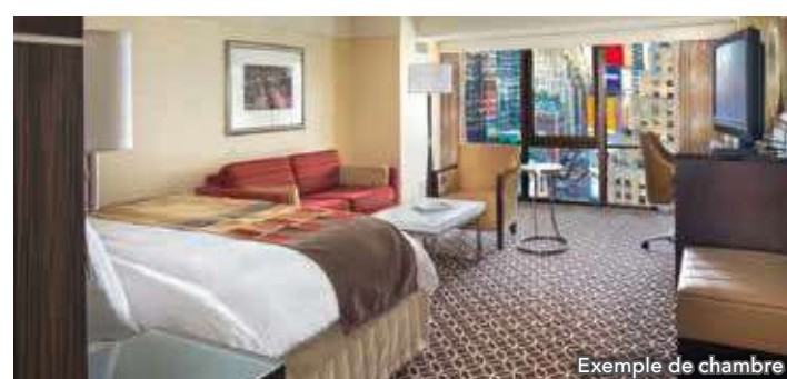
Exemple de chambre