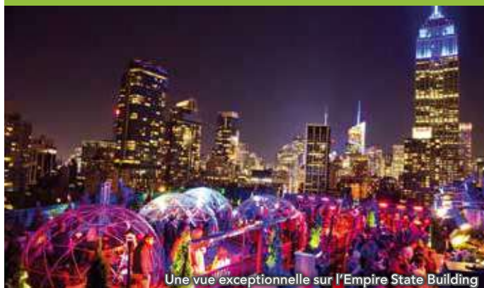
Une vue exceptionnelle sur l'Empire State Building