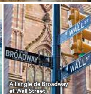
A l'angle de Broadway et Wall Street