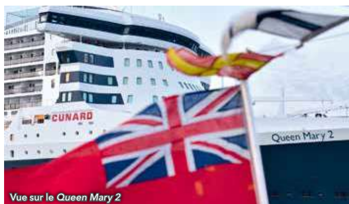
Vue sur le Queen Mary 2